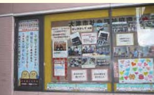
3階のプロムナードに市社協PP看板が設置されています