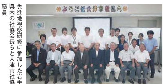
先進地視察研修に参加した岩手県内の社協会長らと大津市社協職員