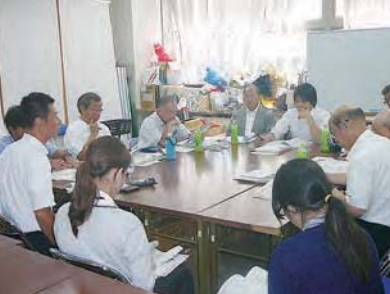
事業の説明のあと2グループに分かれて、トワイライトステイや人材の育成など、様々な質疑が交わされました