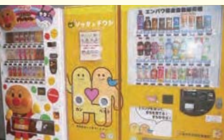
市社協のキャラクター「ソッタとドウジ」が目を引く募金型自動販売機は、天津市役所など市内に14台設置されています

社協組織だけの広報の広がりには限界があり、民間企業の協力を得た新たな広報活動を目指しています。