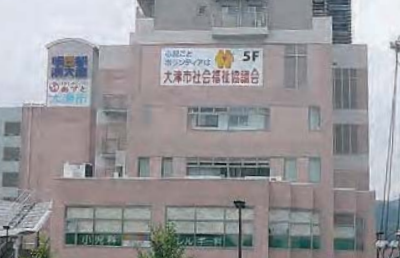
「心配ごとボランティアは天津市社会福祉協議会」と書かれた大型看板（8m×3m）