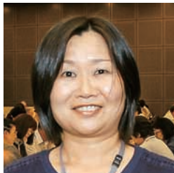
岩手県発達障がい者支援セ ンター ウィズ(岩手県立 療育センター相談支援部)