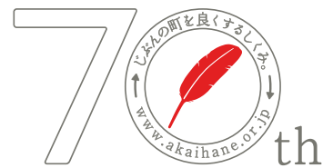
おかげさまで70周年

答申内容を具体化し、明確な目標をもって取り組みを進めるために、推進方策では市町村共同募金委員会（以下、「市町村共募」）の重点目標