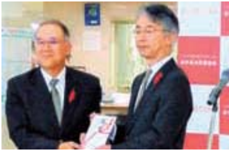
菊池常務執行役員(右)から県共募長山会長(左)に贈呈

として、運動性の再生による共同募金運動の活性化と、多様な人材の参画による住民が主体となった共同募金の展開が挙げられています。 具体的には、社会福祉協議会や民生委員児童委員協議会との連携を基盤としながら、市町村共募への多様な人材の参画を進めるとともに、地域住民が助成審査に参加し、地域住民が主体となった募金運動の展開を実現することとしています。 また、都道府県共同募金会の重点