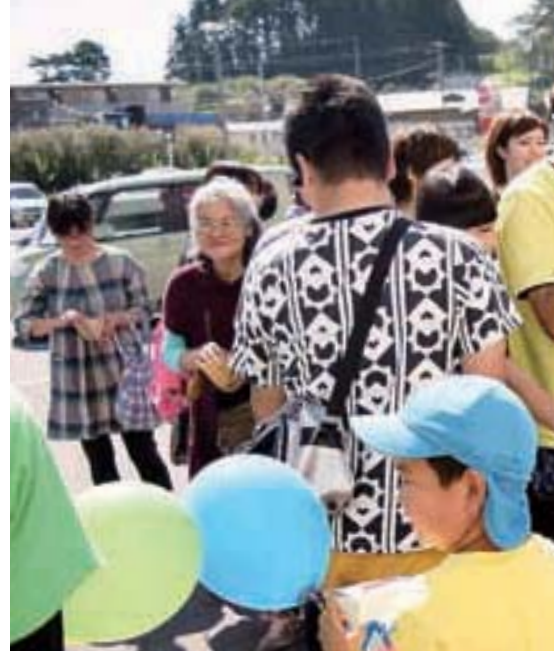
陸前高田市の街頭募金風景

岩手県共同募金会は赤い羽根アクションプランいわて（平成26年～平成30年度）に「新たな募金手法を積極的に取り入れた募金の増額」を掲げ、新たな募金手法の開拓・普及を図りながら、募金増額に取り組んでいます。 うち寄付つき商品は、企業にとって本業の販売促進のメリット及び社会貢献としてのイメージアップに繋がるとともに、寄付金は民間団体等の地域課題解決の財源になり、県内の地域住民のための福祉活動事業や災害見舞金、災害支援事業等に使用されます。