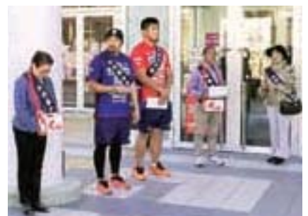
釜石シーウェイブスRFC街頭募金

※平成27年度の岩手県内の募金実績額は前年度に比較して1,403,581円、0.4%の減。1世帯当たり募金額は、728円で島根県と並んで全国1位。戸別募金が約71%を占め、続いて法人募金が10.2%。寄せられた募金の約7割が各市町村における地域福祉活動財源として活用されています。