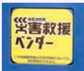
災害救護ベンダー「災害停電時においても飲料供給ができます」のステッカー

設置した赤い羽根自販機には『この自動販売機は災害停電時においても飲料供給ができます』と書かれた充電電池搭載「災害救護ベンダー」のステッカーが貼られています。