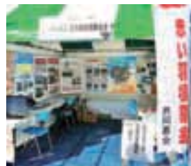
岩手県共同募金会では、全国障害者スポーツ大会希望郷いわて開催会場にも「岩手県台風10号大雨等災害義援金」のブースを設けました

この災害準備金は、平成23年に発生した東日本大震災や平成28年熊本地震、今回の岩手県台風10号大雨災害での被災地ボランティア活動を資金面から支えています。