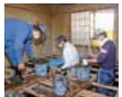
岩泉町災害ボランティアセンターの様子