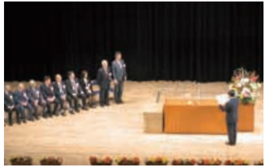
全国社会福祉大会の様子と式典後の記念講演