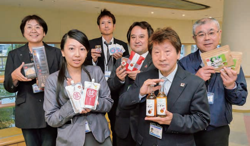
受発注の橋渡しを進める共同受注センターを担当する 福祉経営支援部職員