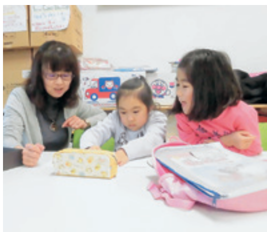
宿題が終わったらいっしょに遊ぼうね

園は、夏期に小学生の学童保育を行っている。その経験を活かし、「アケボノこどもサロン」を月数日、午後3時から7時まで開設（※季節により開設日数は変更し、地域のニーズに応じています。