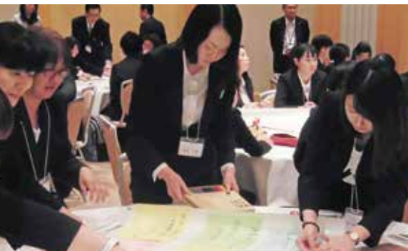
グループごとに目標をまとめる作業