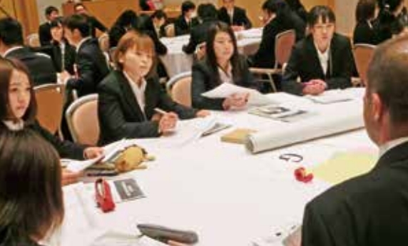
先輩職員の経験談に耳を傾ける参加者