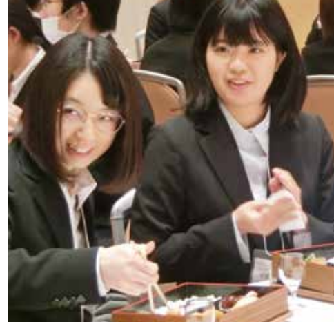
ランチ交流会のひとつ