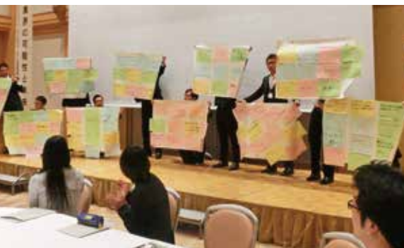
参加者全員で目標共有

《介護に対するポジティブイメージ》 以下、EHI LPMAN JAPAN 介護サービス業 職業イメージ調査2015から抜粋 社会的に意義の大きい仕事だと思つ(38.8%)、 今後成長していく業界だと思つ(30.9%)、雇用 不安の少ない業界だと思つ(15.4%)