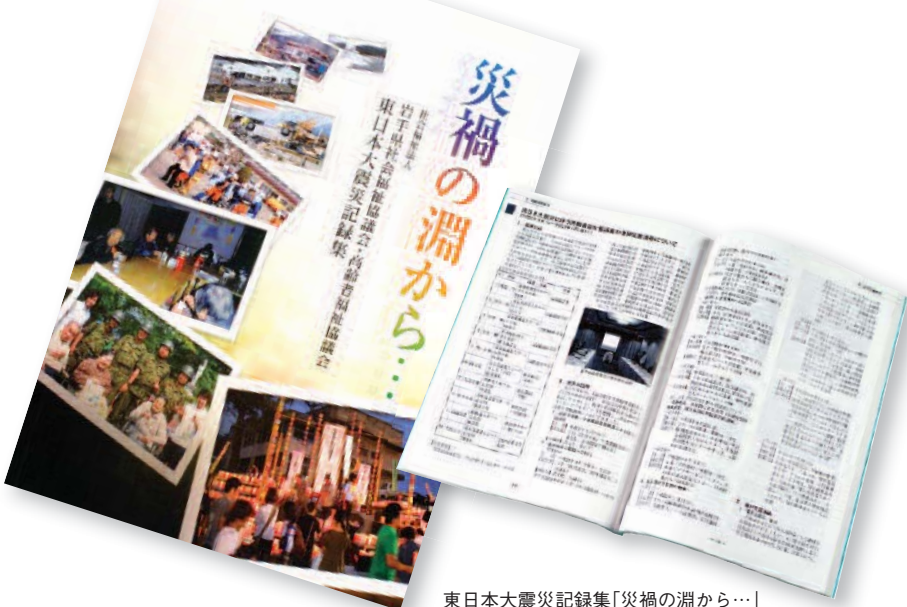
東日本大震災記録集「災禍の淵から…」

先ごろ県社協・高齢者福祉協議会では、東日本大震災記録集「災禍の淵から…」(以下、記録集)と、「働きやすい職場づくりのための取り組み事例集」(以下、事例集)の2冊