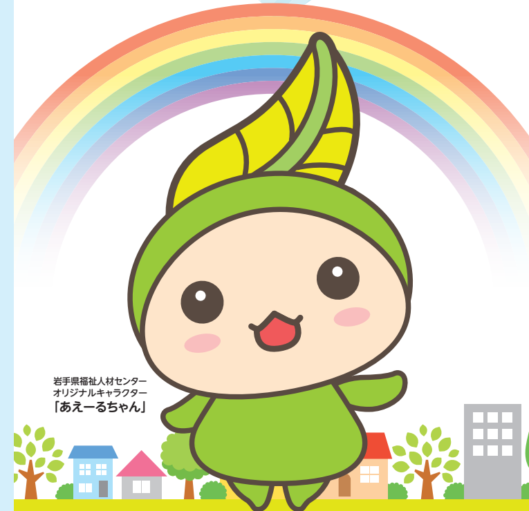
岩手県福祉人材センターオリジナルキャラクター「あえーるちゃん」

いわてけんふくしじんざい 岩手県福祉人材センター (岩手県保育士・保育所支援センター)